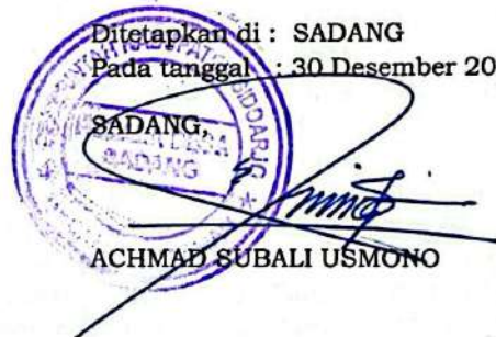
ACHMAD SUBALI USMONO

Ditetapkan di : SADANG Pada tanggal : 30 Desember 2025